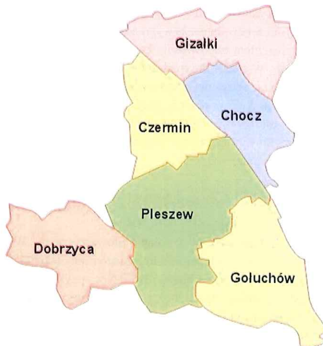
Rysunek 1. Obszar gmin wchodzących w skład LGD Stowarzyszenia „Wspólnie dla Przyszłości”.