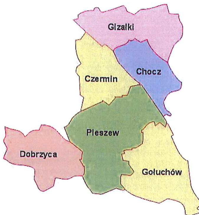
Rysunek 1. Obszar gmin wchodzących w skład LGD Stowarzyszenia „Wspólnie dla Przyszłości”.