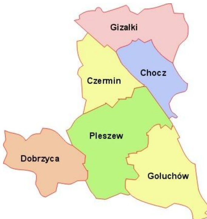
Tabela 1. Wykaz gmin wchodzących w skład LGD.

Rysunek 1. Obszar gmin wchodzących w skład LGD Stowarzyszenia „Wspólnie dla Przyszłości”.